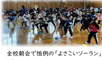
全校朝会で恒例の「よきこソラーン」を練習しました!