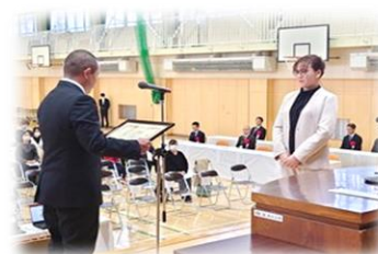
鉦路町PTA連合会研究大会 表彰式

ステップ①⇒ステップ②⇒ステップ③の達成に向けて、より深く自分のことを考えられるように、周りの大人は（学校も家庭も）具体的に言葉にして、子どもに伝え、支えていくことの重要性を強く感じました。